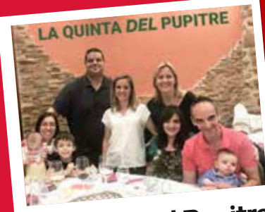
LA QUINTA DEL PUPITRE