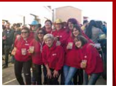
Playa del Rostro