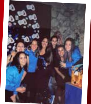
Las mocitas del pueblo