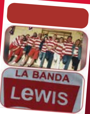
LA BANDA LEWIS