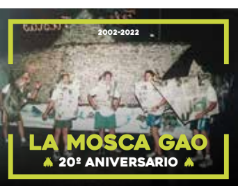
LA MOSCA GAO 2022-2022 20º ANIVERSARIO