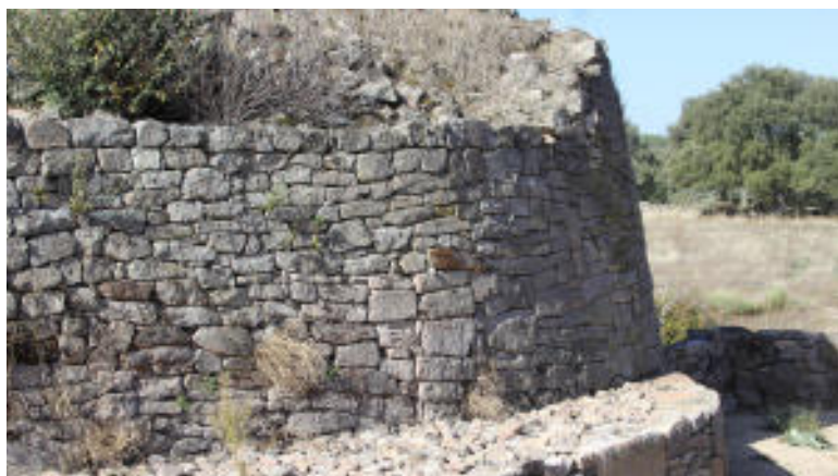
Castro de Yecla de Yeltes