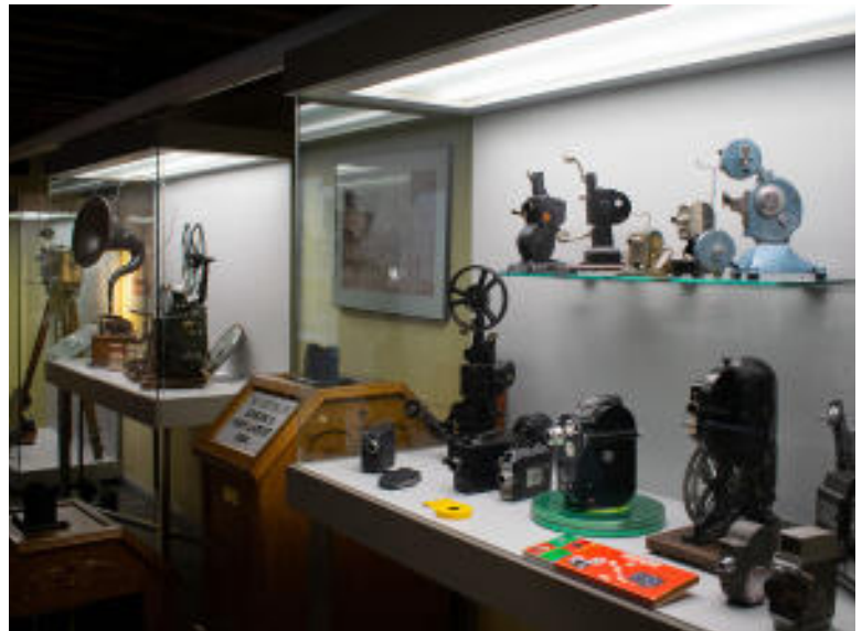
Exposición Artilugios para fascinar. Filmoteca de Castilla y León

Octubre - M a V de 10:00 a 14:00 y 17:00 a 0 h; S, D y F de 10:00 a 14:00 h