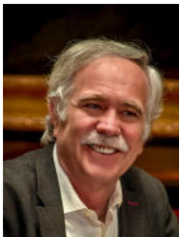
Antonio Pérez Henares