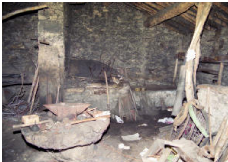
Taller familiar. La fragua de mi pueblo. Museo de Salamanca